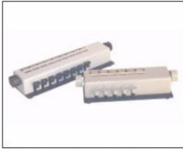
Modelos# DIF50 (5 teclas), DIF80 (8 teclas)